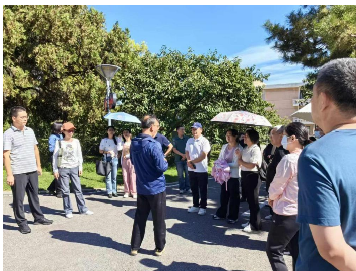
图2 学员在参观调研东经路宾馆老别墅。