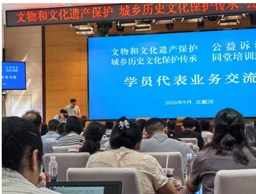
图 5 学员蔡睿结业仪式上代表秦皇岛市进行业务交流。