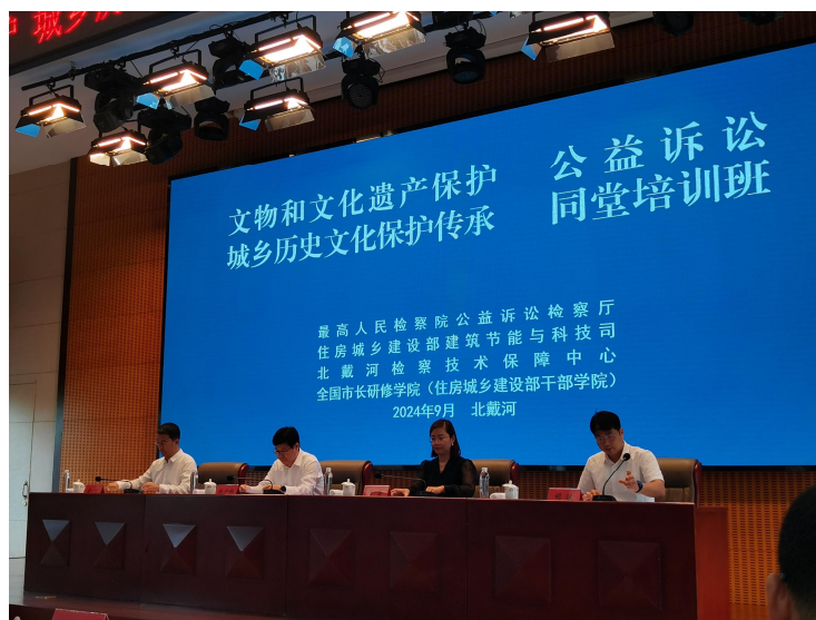
图1 同堂培训班开班仪式。