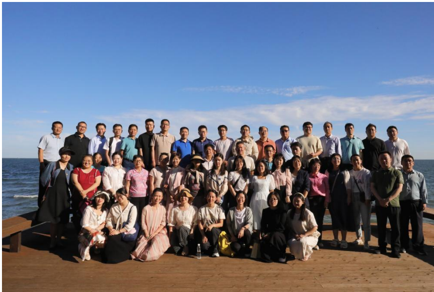
图4 学员在参观调研秦皇岛港大码头历史文化街区合影留念。