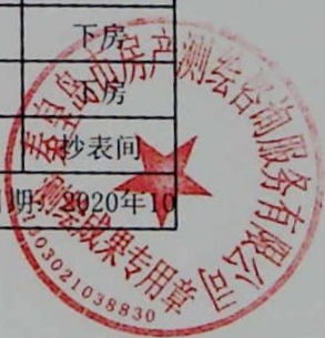
图: 王蕊, 审核: 陈兰兰 测绘单位: 秦皇岛市房产测绘咨询服务有限公司 日期: 2020年10月