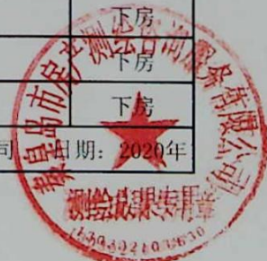
图: 陈嘉伟, 审核: 陈兰兰 测绘单位: 秦皇岛市房产测绘咨询服务有限公司 日期: 2020年