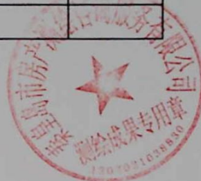
图: 陈嘉伟, 审核: 陈兰兰 测绘单位: 秦皇岛市房产测绘咨询服务有限公司 日期: 2020年1