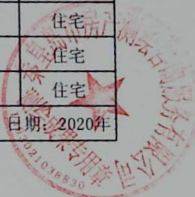
图: 陈嘉伟, 审核: 陈兰兰 测绘单位: 秦皇岛市房产测绘咨询服务有限公司 日期: 2020年