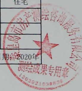
图: 陈兰兰, 审核: 陈嘉伟 测绘单位: 秦皇岛市房产测绘咨询服务有限公司 日期: 2020年