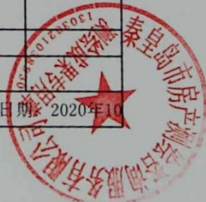
图: 王蕊, 审核: 陈兰兰 测绘单位: 秦皇岛市房产测绘咨询服务有限公司 日期: 2020年10月