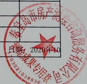
图: 王蕊, 审核: 陈兰兰 测绘单位: 秦皇岛市房产测绘咨询服务有限公司