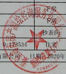
图: 陈嘉伟, 审核: 陈兰兰 测绘单位: 秦皇岛市房产测绘咨询服务有限公司 日期: 2020年