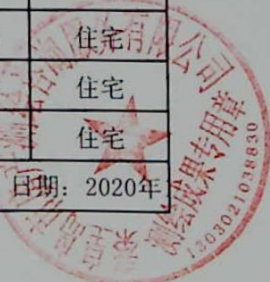
图: 陈嘉伟, 审核: 陈兰兰 测绘单位: 秦皇岛市房产测绘咨询服务有限公司 日期: 2020年