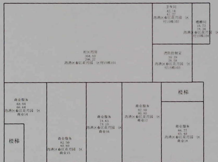
春江花月园一区付15栋及商业14号至商业18号1层平面图