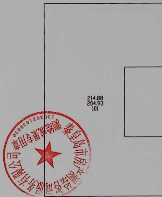
春江花月园一区2栋1层平面图