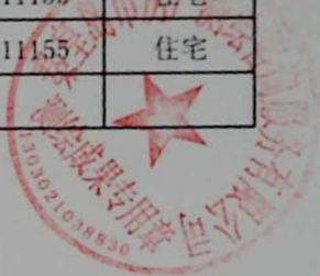
图: 陈嘉伟, 审核: 陈兰兰 测绘单位: 秦皇岛市房产测绘咨询服务有限公司 日期: 2020年1