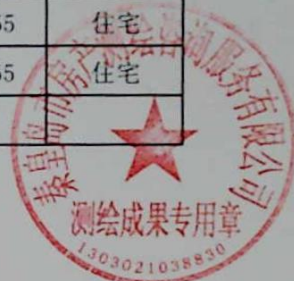
图: 陈嘉伟, 审核: 陈兰兰 测绘单位: 秦皇岛市房产测绘咨询服务有限公司 日期: 2020年1