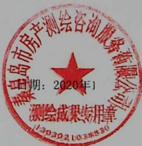
图: 陈嘉伟, 审核: 陈兰兰 测绘单位: 秦皇岛市房产测绘咨询服务有限公司