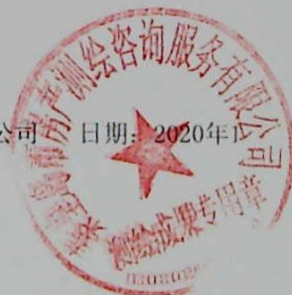
图: 陈嘉伟, 审核: 陈兰兰 测绘单位: 秦皇岛市房产测绘咨询服务有限公司 日期: 2020年