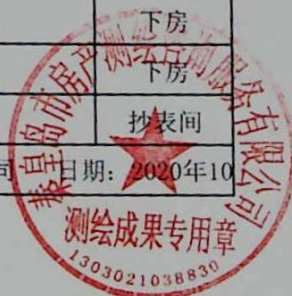
图: 王蕊, 审核: 陈兰兰 测绘单位: 秦皇岛市房产测绘咨询服务有限公司 日期: 2020年10月