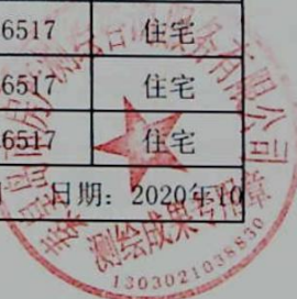
图: 王蕊, 审核: 陈兰兰 测绘单位: 秦皇岛市房产测绘咨询服务有限公司 日期: 2020年10月