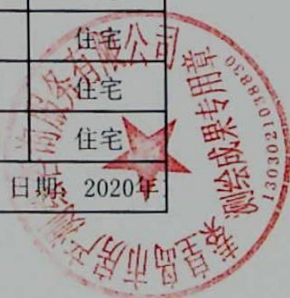
图: 陈嘉伟, 审核: 陈兰兰 测绘单位: 秦皇岛市房产测绘咨询服务有限公司 日期: 2020年