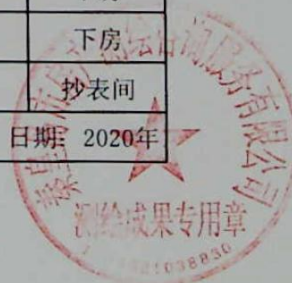
图: 陈嘉伟, 审核: 陈兰兰 测绘单位: 秦皇岛市房产测绘咨询服务有限公司 日期: 2020年