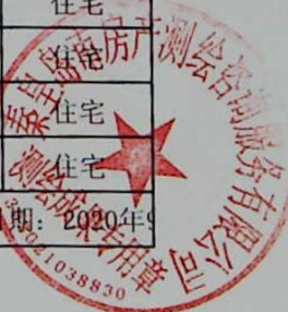
图: 陈兰兰, 审核: 陈嘉伟 测绘单位: 秦皇岛市房产测绘咨询服务有限公司 日期: 2020年9月