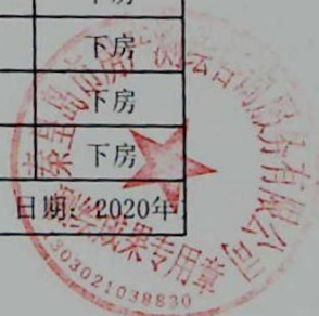
图: 陈嘉伟, 审核: 陈兰兰 测绘单位: 秦皇岛市房产测绘咨询服务有限公司 日期: 2020年